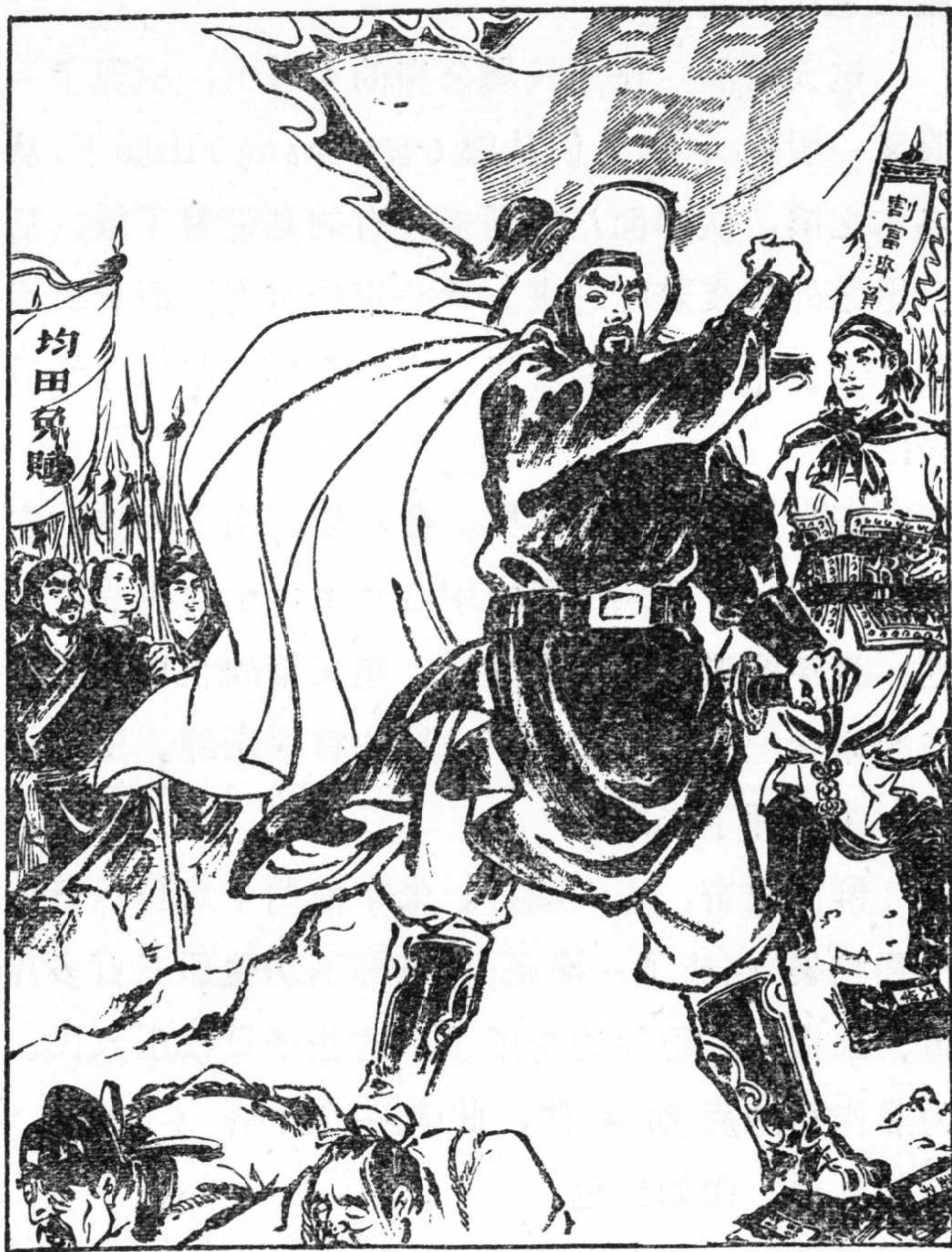
李自成在大会上当众宣布了朱常洵和反动官吏的累累罪行。